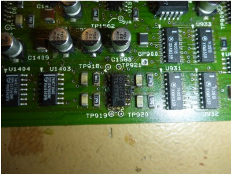
Ein weiterer Ausschnitt des Acquisition Boards