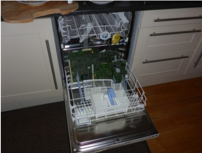
Leiterplattenreinigung in der Spülmaschine