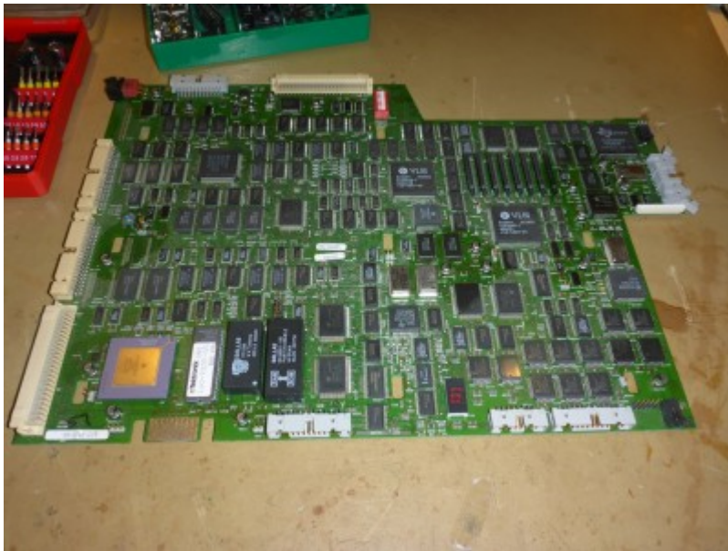
CPU Board, man beachte die dunklen Flecken

entsprechend des Servicehandbuches (erhältlich bei [1]) demontiert. Das gesamte Oszilloskop befand sich in sehr gutem Zustand und wurde unverbastelt vorgefunden. Die Undichtigkeit aller Elkos war jedoch auf der Leiterplatte durch in Elektrolyt getränkten Staub schnell sichtbar. Auf der Leiterplatte waren kaum Schäden sichtbar, nur an wenigen Stellen sah man, dass das Elektrolyt ganze Arbeit geleistet hatte.